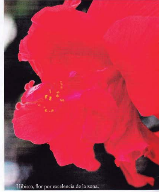
Hibisco, flor por excelencia de la zona.

El hibisco es, sin lugar a dudas, la flor por excelencia de la polinesia neozelandesa encarnada en este maravilloso archipiélago. Hallaremos vivas pinceladas de color a base de hibiscos tanto en la naturaleza, como adornando lujosas suites, en los centros de mesa de las cenas más románticas, decorando el cabello de bellas féminas o cubriendo los cuerpos de los bailarines más hábiles. Viajar a Islas Cook es hacerlo a la Polinesia de hace 30 años. Y es que estamos ante el lugar ideal para aquellos que anhelan alejarse de las rutas turísticas más convencionales. Un destino que, por bello y desconocido, acaba sorprendiendo y grabándose para siempre en la retina de cuantos viaje-