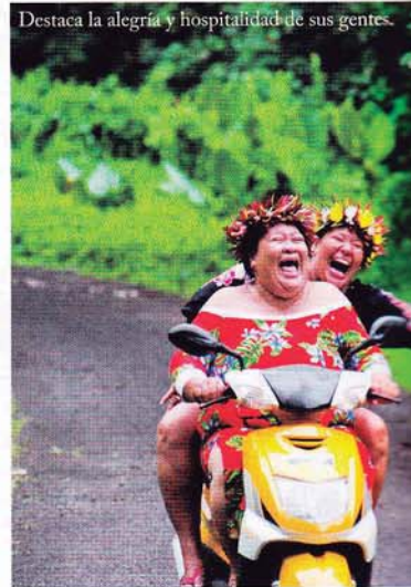
Destaca la alegría y hospitalidad de sus gentes.

ros se dejen engullir por sus encantos. Un lugar diferente con playas de arena fina, arrecifes de coral y verdes montañas volcánicas y donde las sonrisas de sus habitantes siguen siendo sinceras. ¿Qué más se puede pedir para disfrutar de una estancia romántica en el paraíso? El archipiélago, situado en el Océano Pacífico entre Nueva Zelanda y Tahití, se puede dividir en dos grupos. El grupo del norte es perfecto para exploradores y aventureros ya que sus seis atolones están prácticamente inexplorados. El grupo del sur mezcla atolones de coral e islas volcánicas con un idílico clima, impresionantes paisajes y la hospitalidad de sus gentes.