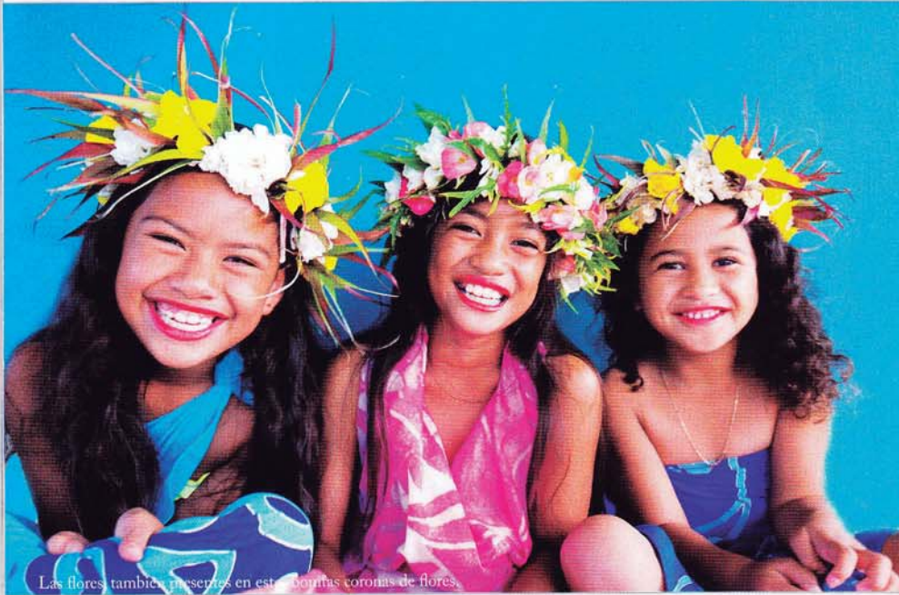
Las flores también presentes en estas bonitas coronas de flores.