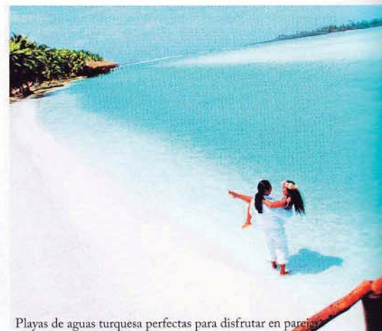
Playas de aguas turquesa perfectas para disfrutar en pareja.