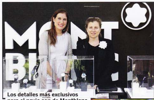
Los detalles más exclusivos para el novio son de Montblanc.