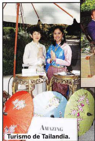
Turismo de Tailandia.

Desde las playas más exóticas de Tailandia o Seychelles hasta la naturaleza más salvaje de Costa Rica, en los hoteles más exclusivos y de la mano de las mejores agencias.