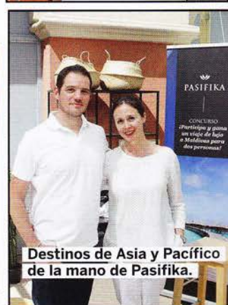
Destinos de Asia y Pacífico de la mano de Pasifika.