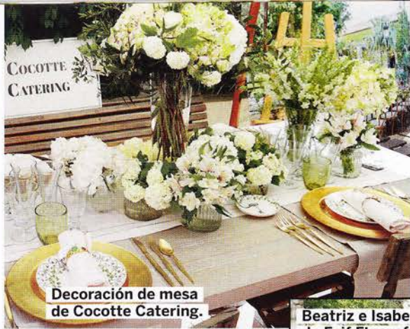
Decoración de mesa de Cocotte Catering.