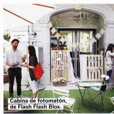
Cabina de fotomatón, de Flash Flash Blox.