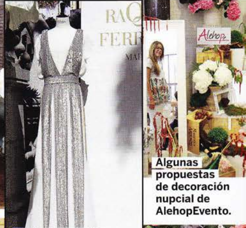
Vestido de novia en blanco y plateado, de Raquel Ferreiro.