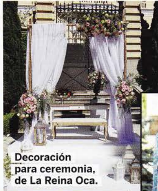
Decoración para ceremonia, de La Reina Oca.