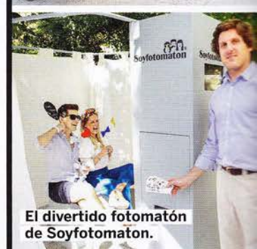
El divertido fotomatón de Soyfotomatón.

Más fotos y vídeo del evento en Telva.com/novias