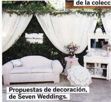
Propuestas de decoración, de Seven Weddings.