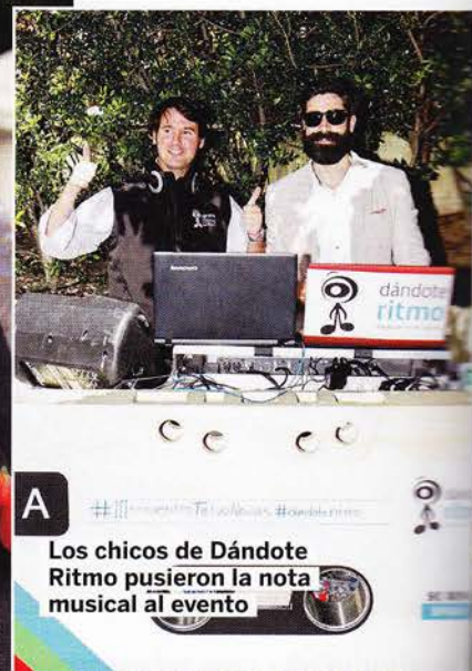
A Los chicos de Dándote Ritmo pusieron la nota musical al evento