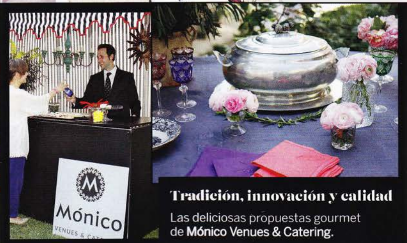
Tradición, innovación y calidad Las deliciosas propuestas gourmet de Mónico Venues & Catering.