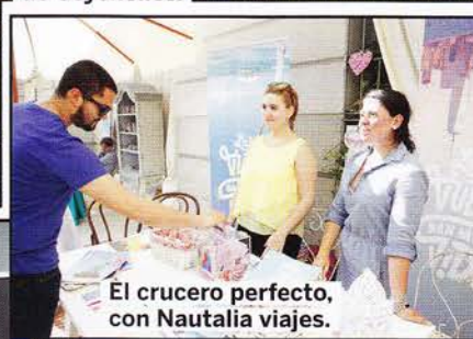
El crucero perfecto, con Nautalia viajes.