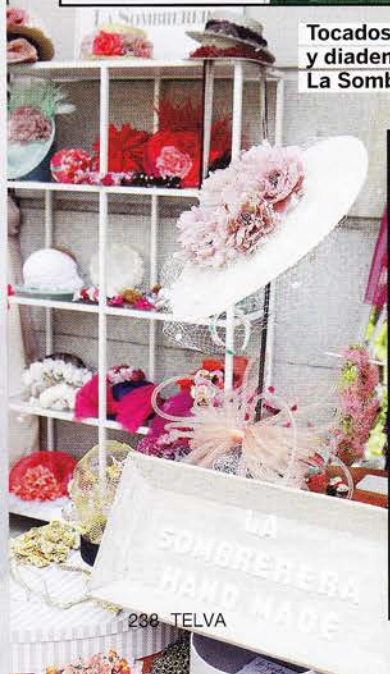
Tocados y diademas de La Sombrerera.