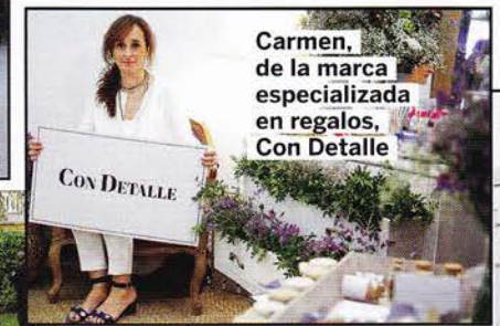
Carmen, de la marca especializada en regalos, Con Detalle