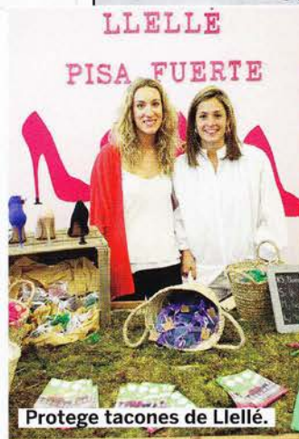
Protege tacones de LLELLÉ.