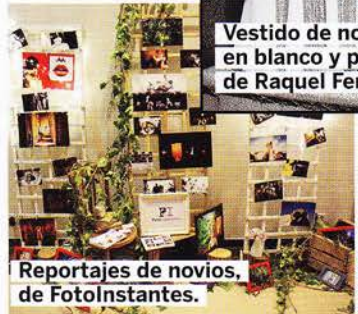
Reportajes de novios, de Fotoinstantes.