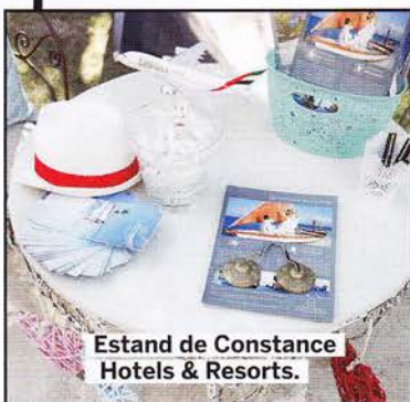
Estand de Constance Hotels & Resorts.