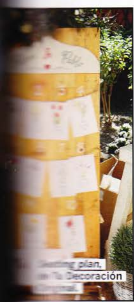
Wedding plan, con Tu Decoración