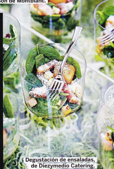
Degustación de ensaladas, de Diez y Medio Catering.

Estand de BodaMás, el portal de bodas online de El Corte Inglés. Un espacio donde encontrar desde el vestido de novia o la lista de bodas perfecta, hasta la luna de miel.