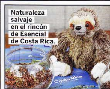
Naturaleza salvaje en el rincón de Esencial de Costa Rica.