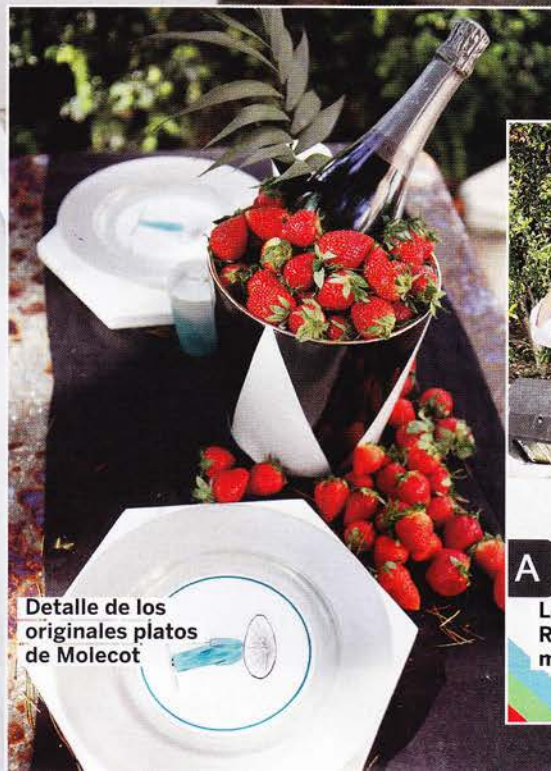
Detalle de los originales platos de Molecot

El 22 de mayo el cielo de Madrid invitaba a salir. En los jardines de la Fundación Lázaro Galdiano aguardaba, además, el evento bridal más esperado: el III Encuentro para novias y profesionales de TELVA Novias . Desde primera hora de la mañana, cientos de personas recorriendo los stands de las empresas participantes y... ¡aforo completo! Novios, madrinas, invitadas, pajes... Había ideas e inspiración para todos. Nadie salió de allí sin una agenda repleta de nuevas direcciones TELVA para su gran día.