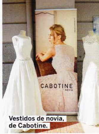
Vestidos de novia, de Cabotine.

Todos los servicios de la Fundación Carmen Pardo-Valcarce tienen detrás el trabajo de profesionales con discapacidad intelectual.