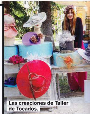
Las creaciones de Taller de Tocados.