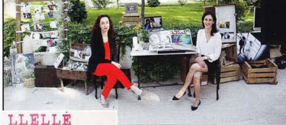
Beatriz e Isabel Olmos, de Esif Fotografía.