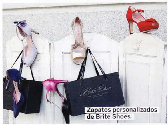
Zapatos personalizados de Brite Shoes.