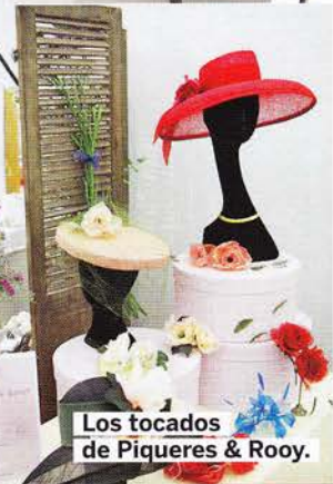
Los tocados de Piqueres & Rooy.