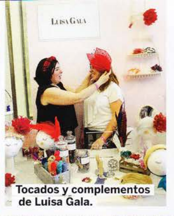
Tocados y complementos de Luisa Gala.