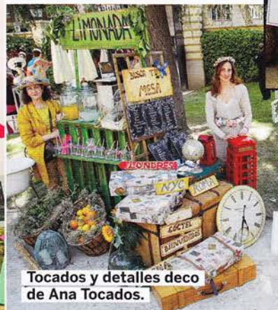
Tocados y detalles deco de Ana Tocados.