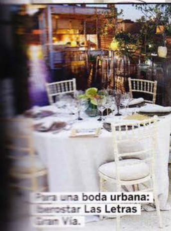
Para una boda urbana: bienestar Las Letras Gran Vía.

Los relojes de Hamilton aúnan el estilo del diseño americano y la precisión Suiza.